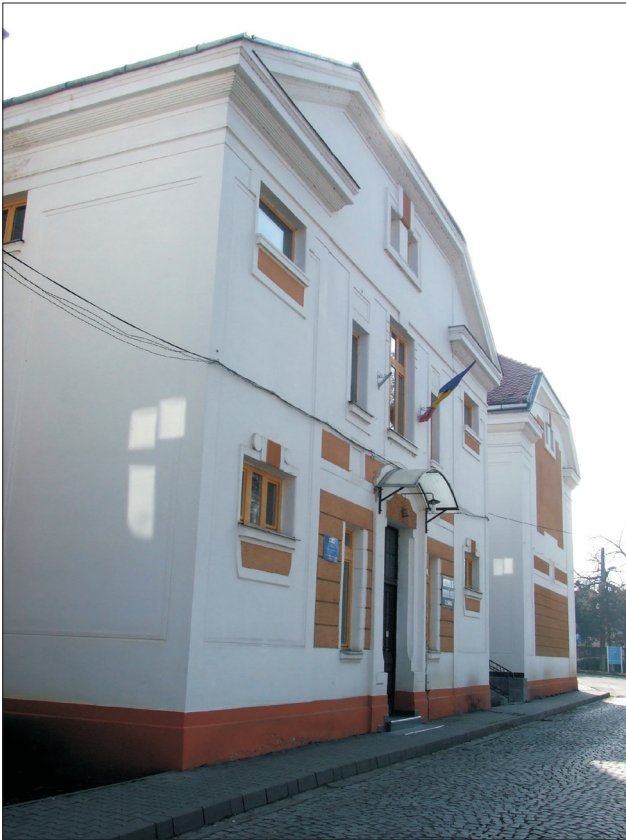
A kórbonctan épülete Gyergyay idejében